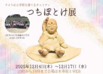
2025年12月4日(木)～12月17日(水) 10時から19時まで会場は本寿院とWEB