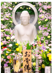
お骨仏3万円から(合祀)