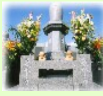
一心(合祀)8万円 本寿(個別)30万円