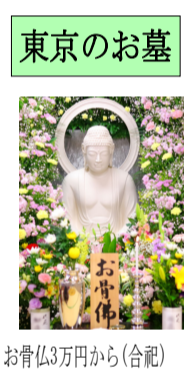
お骨仏3万円から(合祀)

仏様の胎内に遺骨を納め、仏様をお墓のように祈る方法です。いつでもお参りできます。 お骨仏「彼岸法要」 春彼岸 令和7年3月20日(木) 11時 秋彼岸 令和7年9月23日(火) 11時