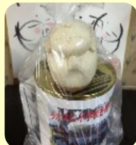
ご縁地蔵と募金箱

寄付金は3校目小学校建設に使わせて頂きます。2027年3月締め切り2028年2月贈呈式に行きましよう。