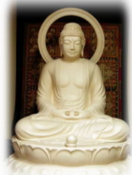
令和7年1月1日より次の通り願

主に変わってご供養法要を厳修させて頂く事になりました。各お寺にてご命日の朝に厳修させて頂きますのでどうぞ、ご休心ください ■1年供養 3万円 ■10年供養 10万円 ■10年間ご命日と納骨時にご供養 ■永代供養 20万円 ■33年間ご命日と納骨時にご供養