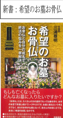
新書: 希望のお墓お骨仏

書籍「戒名って高い？安い？」「戒名を自分で付けてもいいですか」「希望のお墓お骨仏」