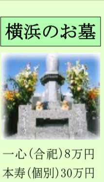
一心(合祀)8万円 本寿(個別)30万円

みんなで入るお墓(合祀墓) 春法要…令和7年4月6日(日) 14時 春法要…令和7年10月5日(日) 14時