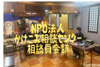
の方も多くと存じます。また、コロナ禍で長らく中断しておりました「一杯ご飯の会」ですが、開催

令和7年かけこみ相談 「一杯ご飯の会」 3月10日(月) 19時 6月9日(月) 〃 11月10日(月) 〃