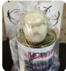
ご縁地蔵と募金箱

昨年開催された第8回横浜そごうチャリティつちぼとけ展では多くの方がお越し下さり、ありがとうございます。皆様のご協力で25万8800円の募金が集まりました。小学校建設に全額寄付させていただきます。