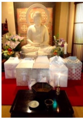
骨仏への生前予約で 人生前向きに!

お骨仏には生前で納骨を申込されている方も多くいらっしゃいます。生前納骨申込の方は、お亡くなりになった後、申込者の祭祀継承者であるご家族・相続人・遺贈者など一定の方からご連絡をいただくこととなります。お骨仏への見学は随時承っております。