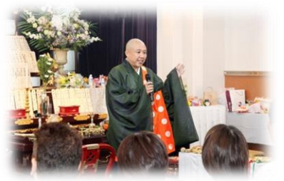
④各法要最後に住職のご法話がございます。