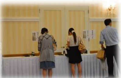
①受付・塔婆ご記入