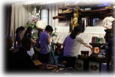
②お子様の水子塔婆をたてて、焼香