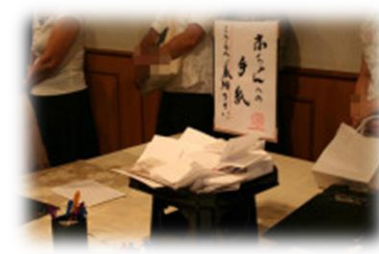
赤ちゃんへのお手紙もお書き下さい。

服装は平服で構いません。 お供え物(お花やお菓子等) お手紙のある方はお持ちください。