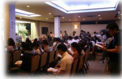
③一緒に般若心経をお唱え下さい。