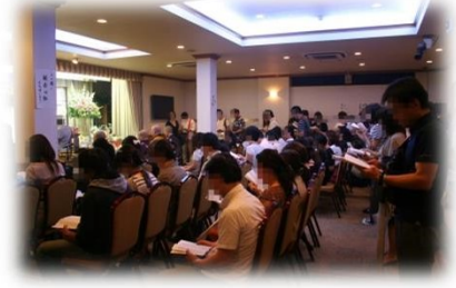
お時間のある方はご一緒に般若心経をお唱え下さい。