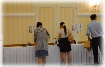
受付・塔婆ご記入