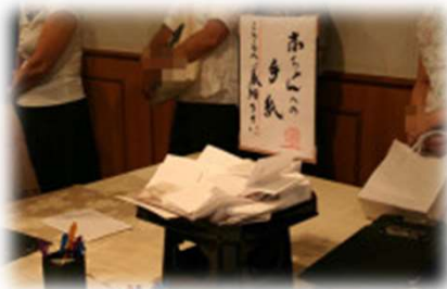
赤ちゃんへのお手紙