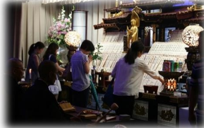
お子様の水子塔婆をたてて、焼香